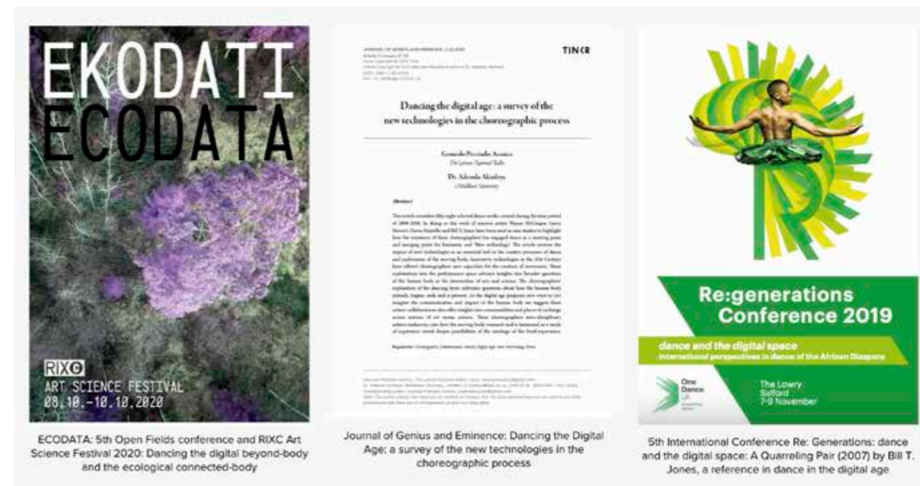
Producción artístico-científica más reciente. Página web de SPACE+DIGITAL+DANCE .

dense Journal of Genius and Eminence editada por el conocido psicólogo cognitivo Mark Runco —a través del International Center for Studies in Creativity con sede en Nueva York—. Esta publicación, resultado de la investigación que he llevado a cabo junto a Akinleye entre Londres y Riga, analiza el impacto de las nuevas tecnologías como una herramienta fundamental en el proceso coreográfico y la exploración del cuerpo. Para estudiar como estas técnicas vanguardistas ofrecen a los creadores nuevas capacidades para la elaboración de movimiento, hemos analizado cincuenta y ocho obras creadas entre 2000 y 2018 por reconocidos coreógrafos que trabajan con nuevos medios: Wayne McGregor, Garry Stewart, Dawn Stopiello y Bill T. Jones. Los resultados preliminares se presentaron en Manchester en la conferencia internacional Re: generations —dance and the digital space . Además, creamos una