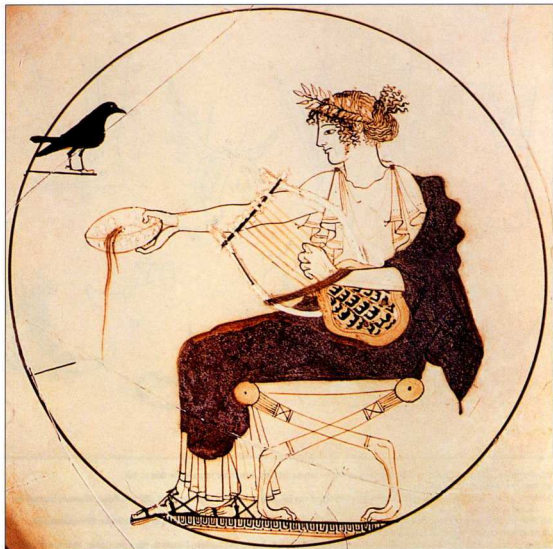
39. Ο Απόλλων φοράει σανδάλια του τύπου των άπλων, σε στική κύλικα του ζωγράφου της Ελευσίνας, περ. 500 π.Χ. Δελφοί, Αρχαιολογικό Μουσείο.

μπότες οι οποίες κάλυπταν και το κάτω μέρος του ποδιού 43 τις φορούσαν τα μέλη της τάξης των ιππέων και οι απελευθερωμένοι 44 .