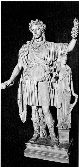
42. Άγαλμα του Διονύσου με μπότες του τύπου των σουλβάν , ρωμαϊκό αντίγραφο αγάλματος που χρονολογείται στις αρχές του 4ου αι. π.Χ. και αποδίδεται στον Κηροδόδο τον Πρεσβύτερο, Αγία Πετρούπολη, Μουσείο Ερμιτάζ.

Ο τύπος αυτός πιθανώς συμπίπτει με την ένδρομιδα , μια γούνινη, ψηλή και ανοιχτού τύπου μπότα, η οποία κάλυπτε το πόδι μέχρι την κνήμη.